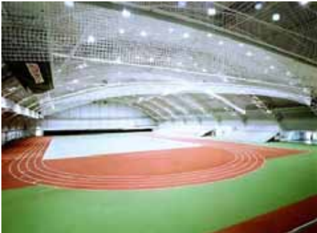
Hippohalli odottaa juhluvieraita

Suomen Viikkolehden viikolla 24 ilmestyvässä numerossa on liitteenä 4-sivuinen kesäjuhlalehti. Liitteessä on juhlisiin liittyviä juttuja sekä juhlien kaikkien eri tilaisuuksien ohjelma. Tämä lehti postitetaan kaikkiin vapaakirkollisiin talouksiin.