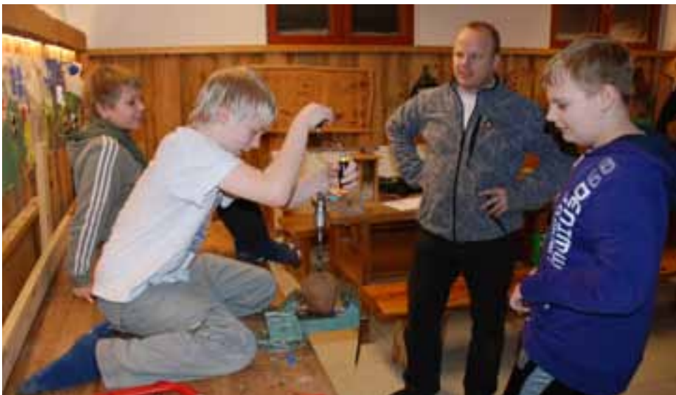
YKSI PARTIOLAISEN TAPA AVATA KOOKOSPÄHKINÄ